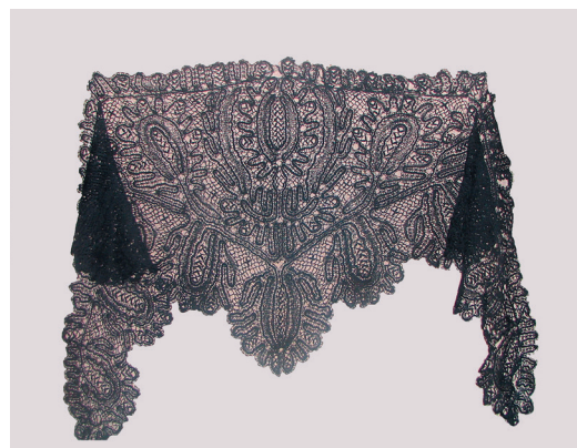
Женский головной убор – «файшонка». Из шелковых нитей, коклюшечное кружево. Из частной коллекции с. Волчанка Москаленского р-на Омской обл.