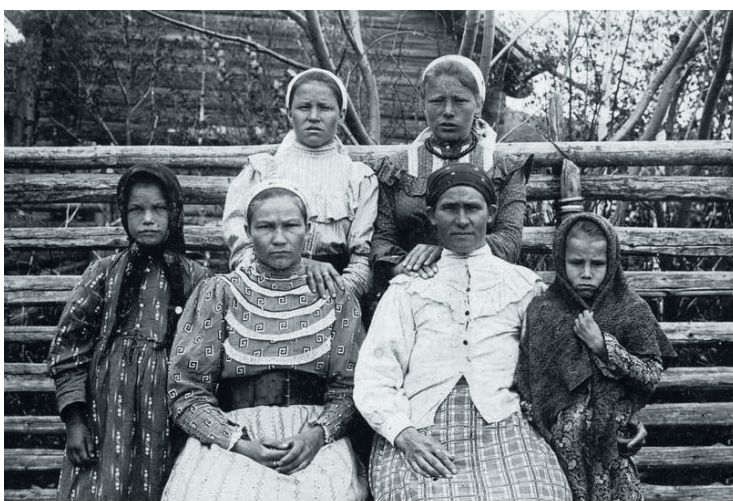
Казачки. Из альбома Н.Г. Катанаева «Типы казаков. Сибирские казаки на службе и дома», 1909 г.