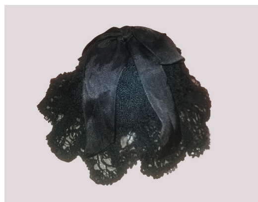
Женский головной убор – «наколок». Из кружева, ленты, хлопчатобумажной ткани. Из фондов ОГИК музея