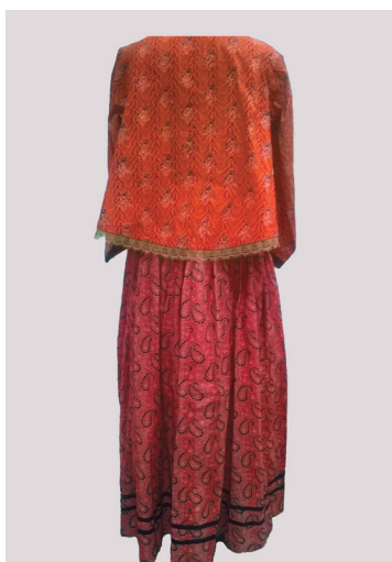
Праздничная «парочка». Из хлопчатобумажной ткани, верхний элемент (кофта) с хлопчатобумажным подкладом, отделкой машинным кружевом, сутажем, фигурной строчкой. Из фондов ОГИК музея.