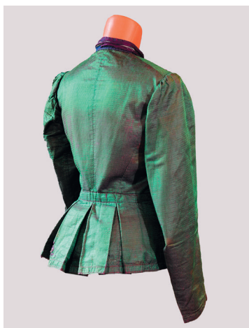
Праздничная «парочка» (элемент). Из шелковой тафты с хлопчатобумажным подкладом. Из фондов Марьяновского районного краеведческого историко-художественного музея Омской обл.